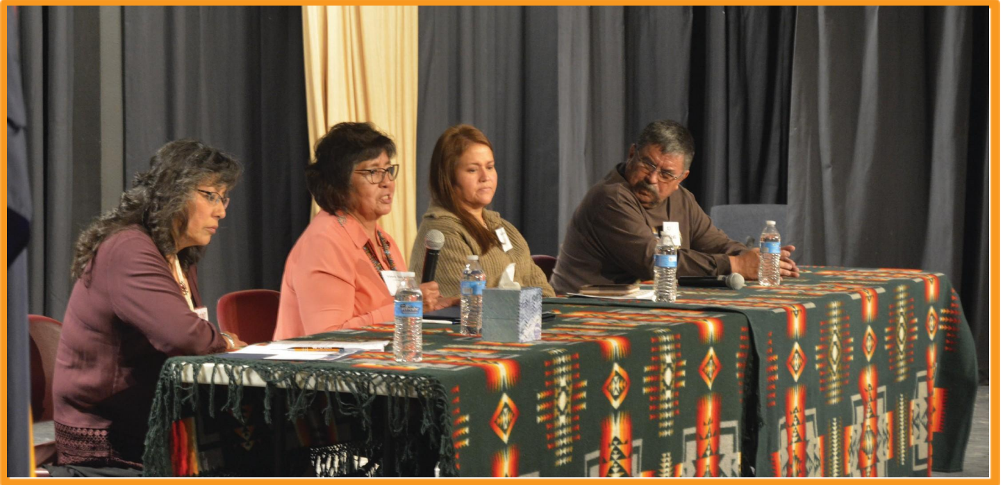
Window Rock, AZ: Los cuidadores y los sobrevivientes comparten sus experiencias en la Conferencia de Supervivencia al Cáncer 2018, en una sesión facilitada por PFAC.