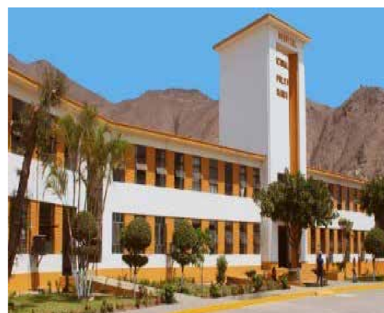
GRÁFICO 4. HOSPITAL NACIONAL SERGIO E. BERNALES