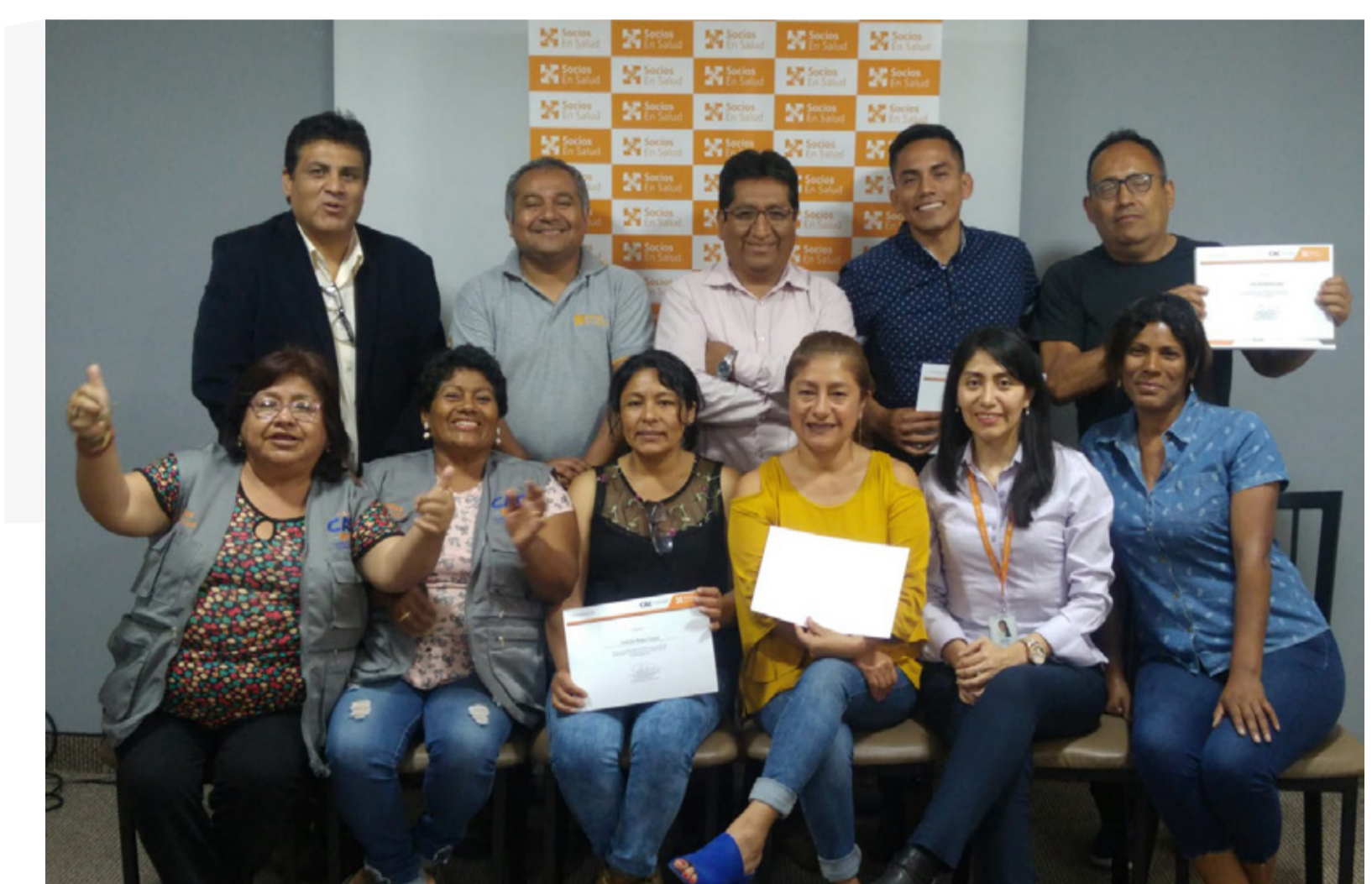
FIGURA 1. MIEMBROS DEL CAC SES

El CAC SES asegura el impacto de nuestras intervenciones SES potenciando los beneficios a la comunidad.