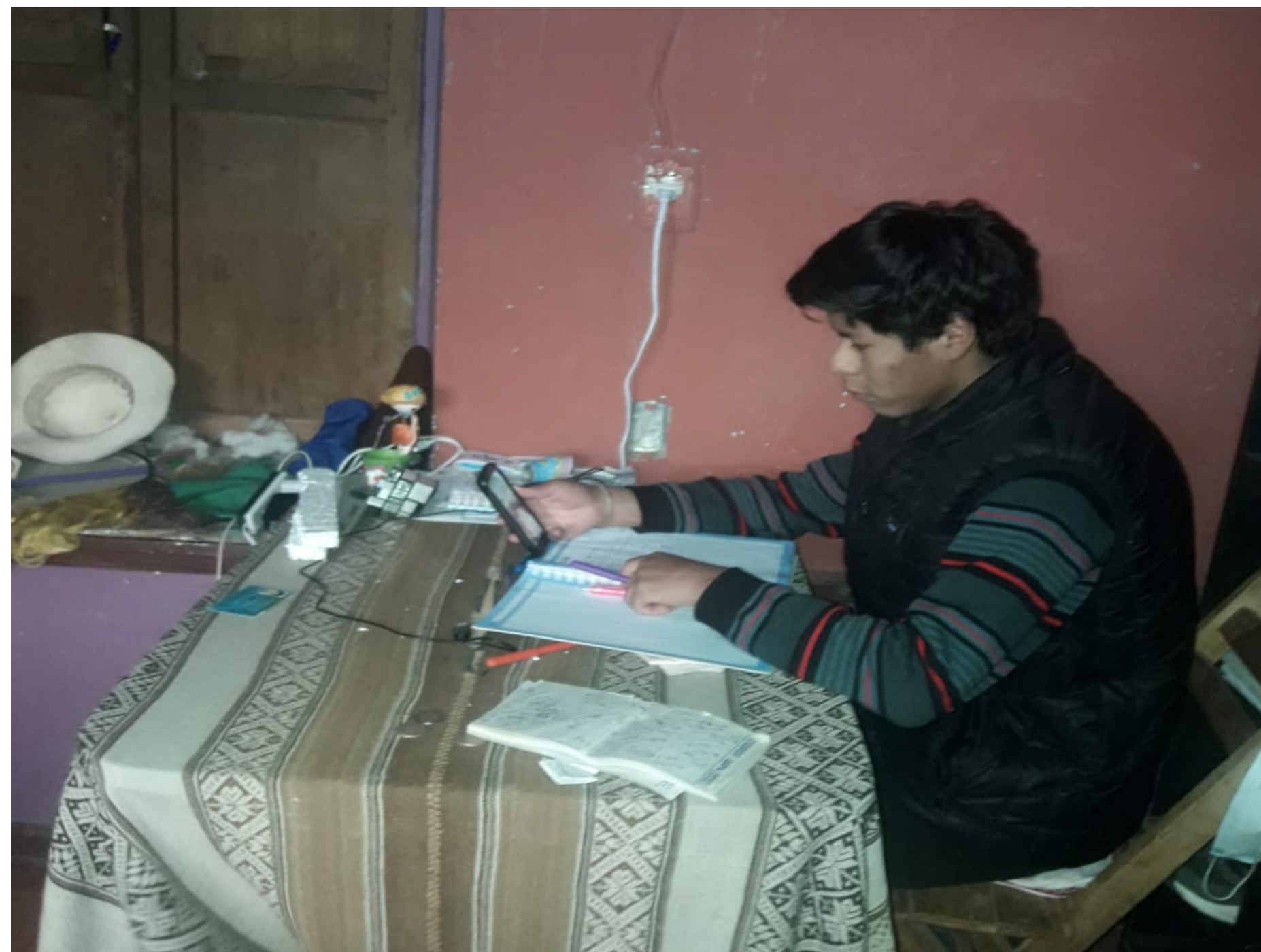
FIGURA 2. BECARIO DESARROLLANDO SU CURSO VIRTUAL EN LA COMUNIDAD DE TINTAY PUNCO- HUANCVELICA.

El becario firma un acta de compromiso antes de ser matriculado para cumplir los procesos de seguimiento en el tiempo que dure su formación académica (Figura 2 y 3). El apoyo que se brinda a cada becario ganador es con la matrícula, mensualidad y recarga de internet el cual implica el cumplimiento y responsabilidad de cada becario para su desarrollo profesional. El monitoreo constante en su rendimiento académico como: promedio de notas, número de inasistencias condicionan a la suspensión total o parcial de la BECA.